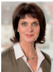
Vera Reiß Ministerin für Bildung, Wissenschaft, Weiter- bildung und Kultur