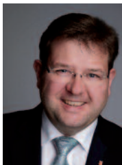
Joachim Kandels Bürgermeister der Stadt Bitburg