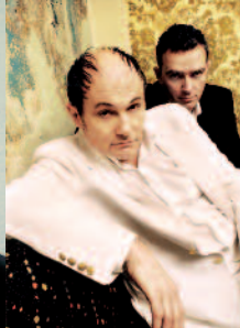
Pigor & Eichhorn