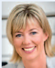
Doris Ahnen Ministerin für Bildung, Wissenschaft, Jugend und Kultur und Vorsitzende des Kultursommers Rheinland-Pfalz e. V.